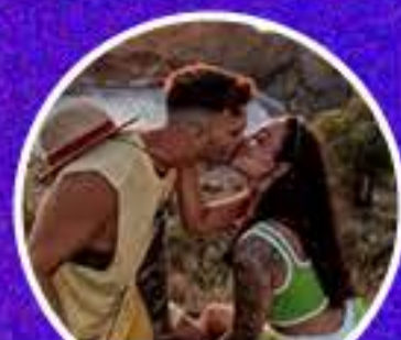
Lyly et Jay