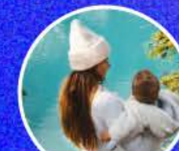
On met les voiles