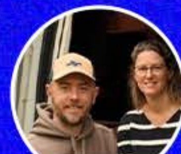
Van Life Voyages